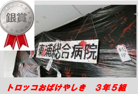
トロツコおばけやしき 3年5組