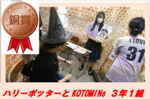
ハリーポッターとKOTOMINS 3年1組