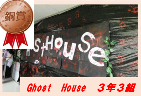
Ghost House 3年3組